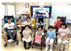
中学校とのオンライン交流