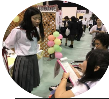
校外でのインタビュー