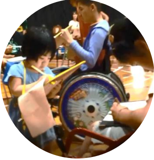
校内での合同授業

学校の授業で伝え合うことで、普段の生活だけでは得られにくい様々な価値観に触れる体験をします