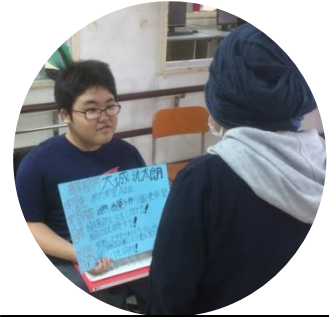
各学部での学校内外での活動