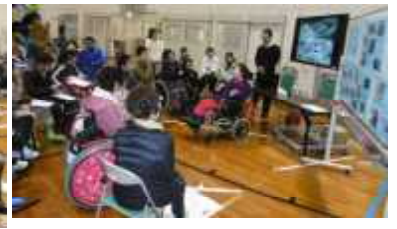
【↑講師4名「卒業生講話」夢実現とは何かを熱心に聞きました】

【↑青年教室「成人祝賀会」】17名の成人の皆さんを170名の参加者がお祝いしました。成人おめでとう。