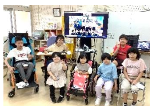
中学校とのオンライン交流