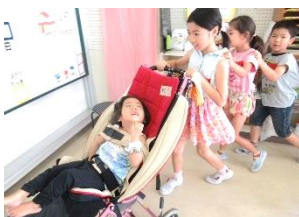
小学校との直接交流